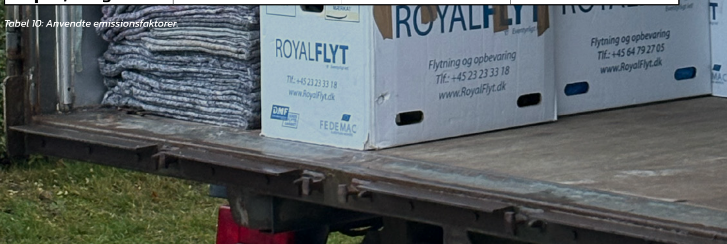
Tabel 10: Anvendte emissionsfaktorer.